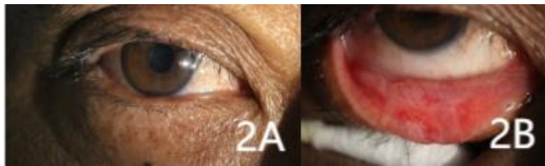
图 1 结膜乳头状瘤患者术后 7 天右眼眼前节像 右眼睑球结膜充血，乳头状瘤消失